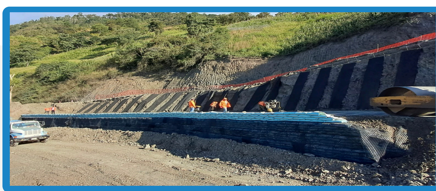
Colocación del sistema de subdrenaje en el espaldar y conformación del muro con geomallas uniaxiales