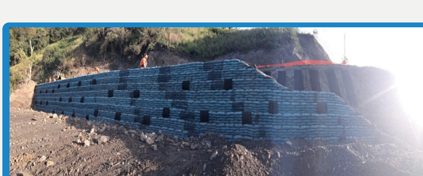
Vista frontal del muro conformado. Se aprecian las franjas de subdrenaje horizontal que sobresalen en la fachada