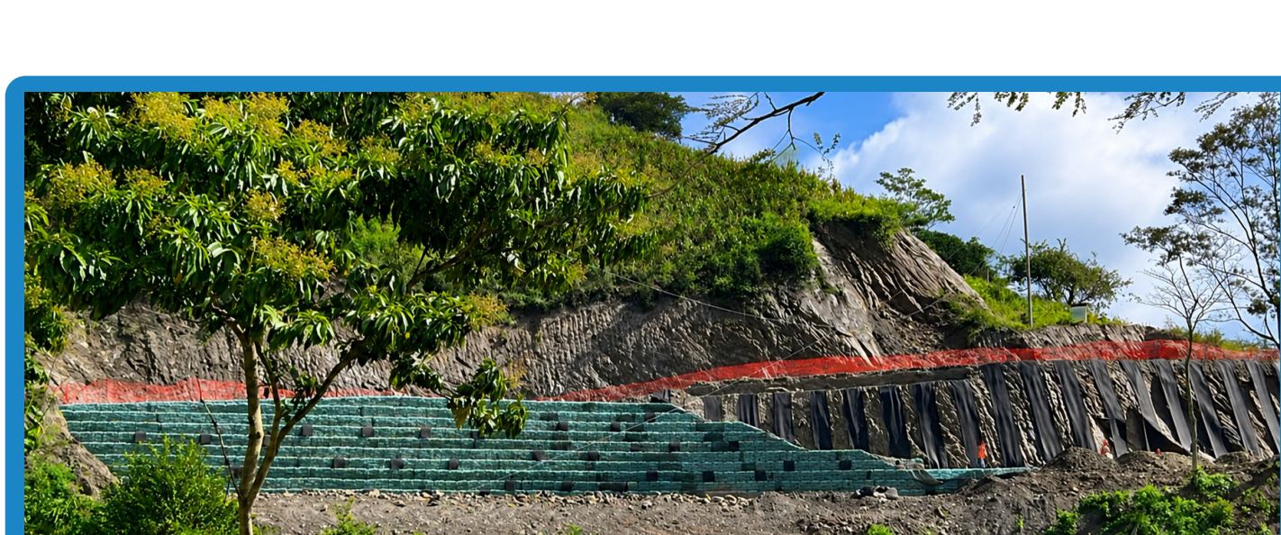
Avance del proceso de construcción por escalones a manera de dovelas

Este proyecto demuestra cómo una solución basada en geosintéticos puede transformar un escenario de alto riesgo en una infraestructura estable, segura y durable, aportando valor tanto desde el punto de vista técnico como económico.