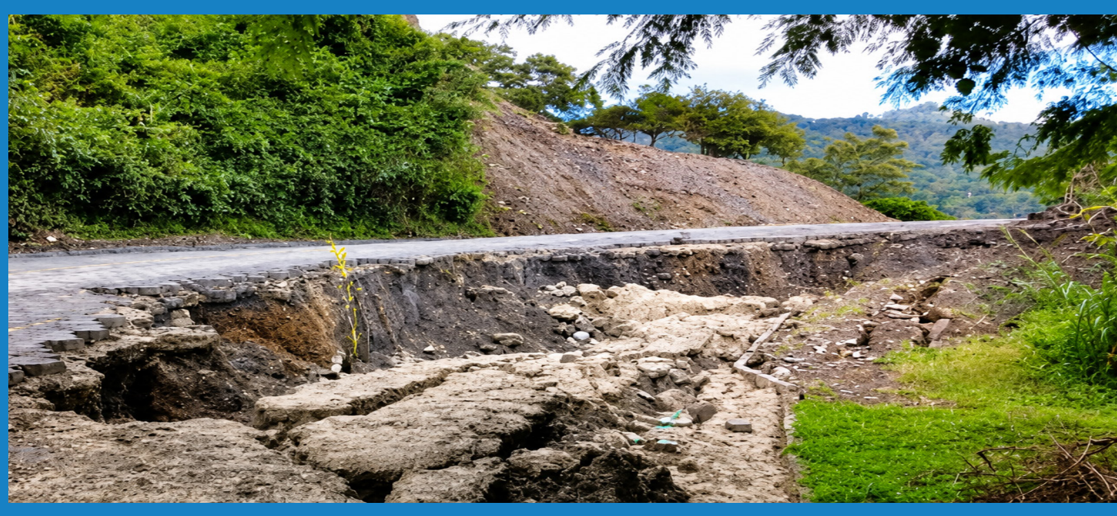
Aspecto de la vía en el sector del deslizamiento

Este escenario requería una intervención urgente, ya que, de no ser tratado, podía derivar en la pérdida total del tramo vial, afectando significativamente la conectividad de la región y generando mayores costos de rehabilitación en el futuro.